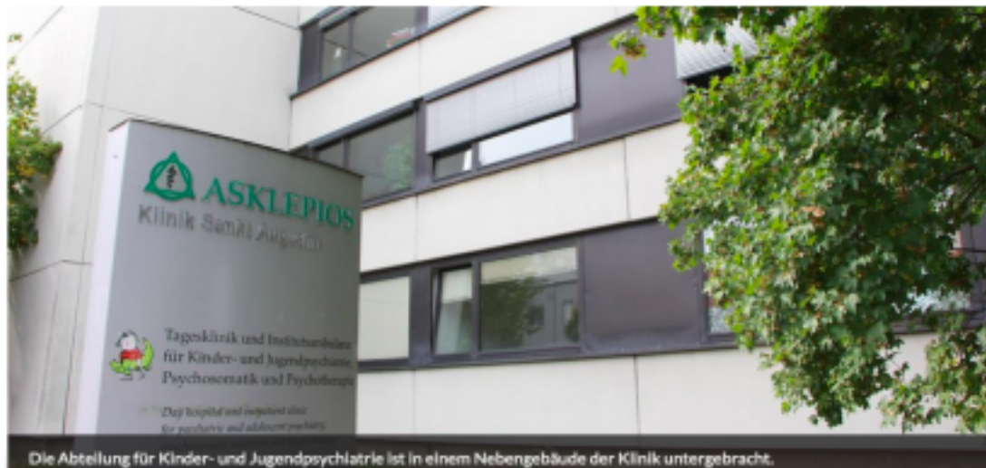
Die Abteilung für Kinder- und Jugendpsychiatrie ist in einem Nebengebäude der Klinik untergebracht.